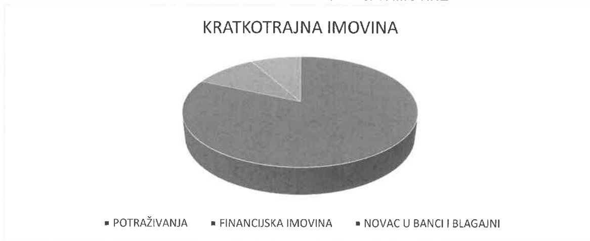
Graf 2. STRUKTURA KRATKOTRAJNE IMOVINE

Kapital i rezerve čine 35% pasive. Temeljni kapital iznosi 47.586.200 kn, a revalorizacijske rezerve 86.639. Zadržana dobit prethodnih godina iznosi 2.907.165 kn, a dobit tekuće godine 75.792 kn.