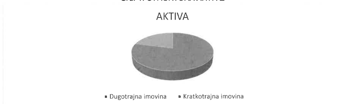
Graf 1. STRUKTURA AKTIVE

Iz analize bilance za 2020. godinu vidljivo je da dugotrajna imovina sudjeluje sa 79% u aktivi.