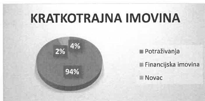
Graf 2. STRUKTURA KRATKOTRAJNE IMOVINE

Kapital i rezerve čine 18% pasive. Dugoročne obveze čine <1%, a kratkoročne obveze 19% ukupne pasive. U strukturi kratkoročnih obveza 75% čine obveze prema dobavljačima. Odgođeno plaćanje troškova i prihod budućeg razdoblja čine 63% ukupne pasive.